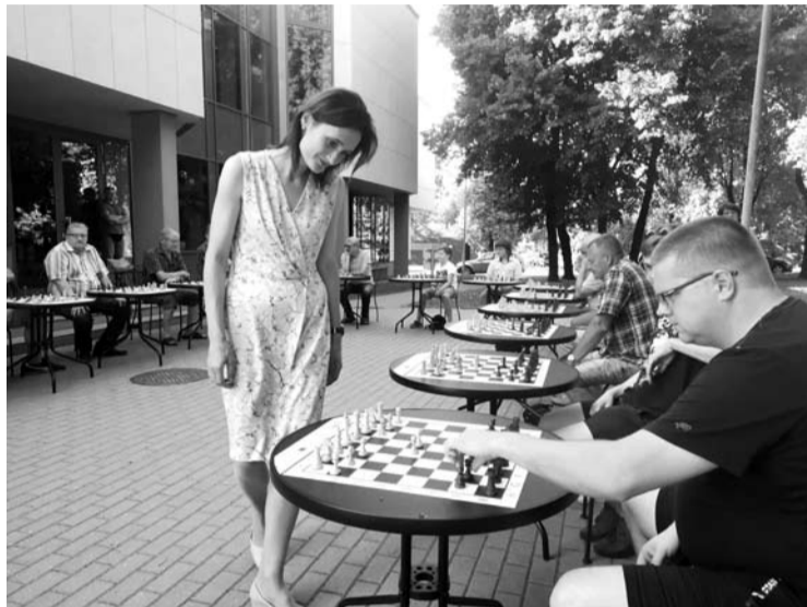
Kepinant daugiau nei 30 laipsnių karščiui, Seimo pirmininkė Viktorija Čmilytė – Nielsen daugiau nei dvi valandas Anykščiuose žaidė šachmatais.